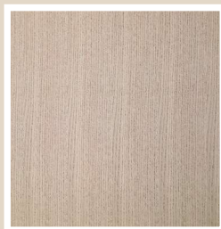
ホワイトオーク(柾目)