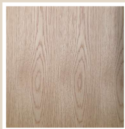
ホワイトオーク(板目)