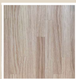
ホワイトオーク ブロック